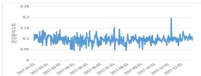
그림 2.시계열 형태의 1일단위 감성분석 평균 값

LSTM은 신경망의 일종으로 시계열 데이터를 다루는데 특화된 딥 러닝 모델이다. 1일 단위의 감성 분석 평균값은 그림2와 같이 시계열의 데이터 형태로 나타나기 때문에 LSTM 모델의 input 값으로 적합하다. LSTM 모델의 feature들로는 총 기사의 수, 긍정적인 기사의 수, 1일 단위 감성분석 평균값을 넣었으며 label로는 증가를 설정했다.